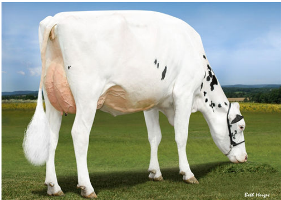
LADYS-MANOR GRNT OOHM DAM